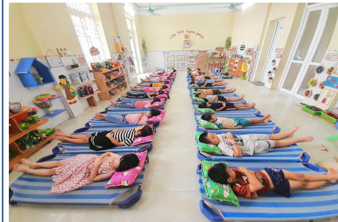
Hình ảnh 16: Hoạt động giờ ngủ trưa