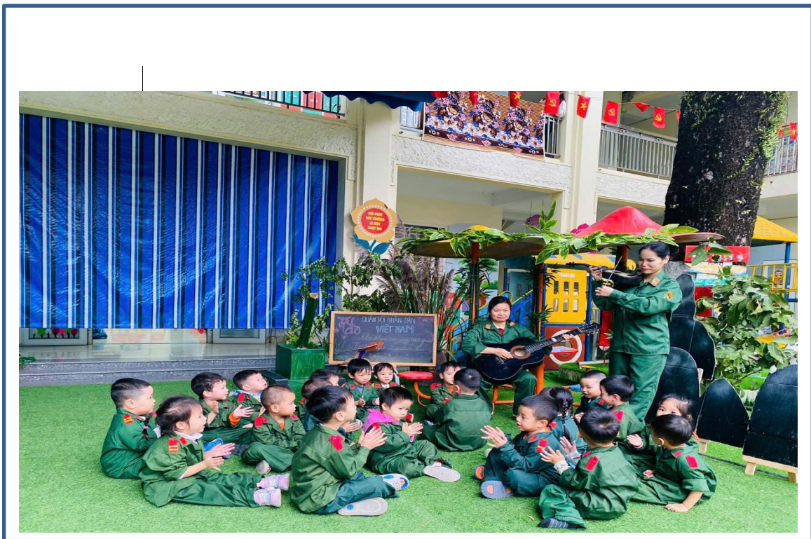
Hình ảnh 8: Trẻ cùng cô chơi đàn trong giờ âm nhạc