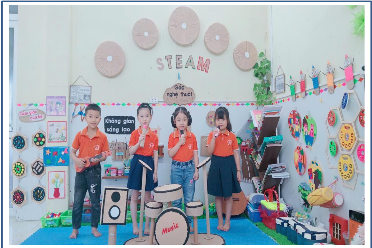
Hình ảnh 13: Trẻ tham gia hoạt động góc