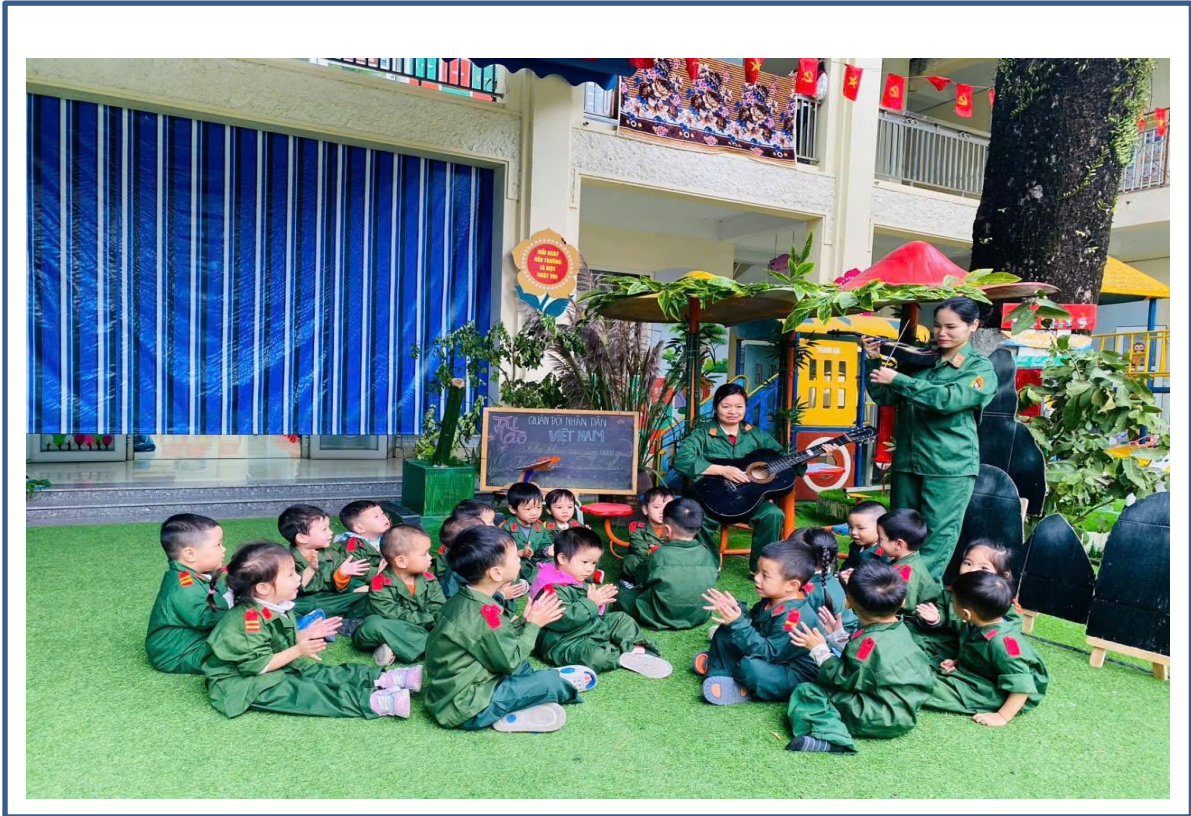
Hình ảnh 11 : Trẻ nghe hát trong giờ hoạt động âm nhạc