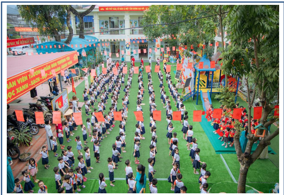
Hình ảnh 14: Hoạt động thể dục sáng