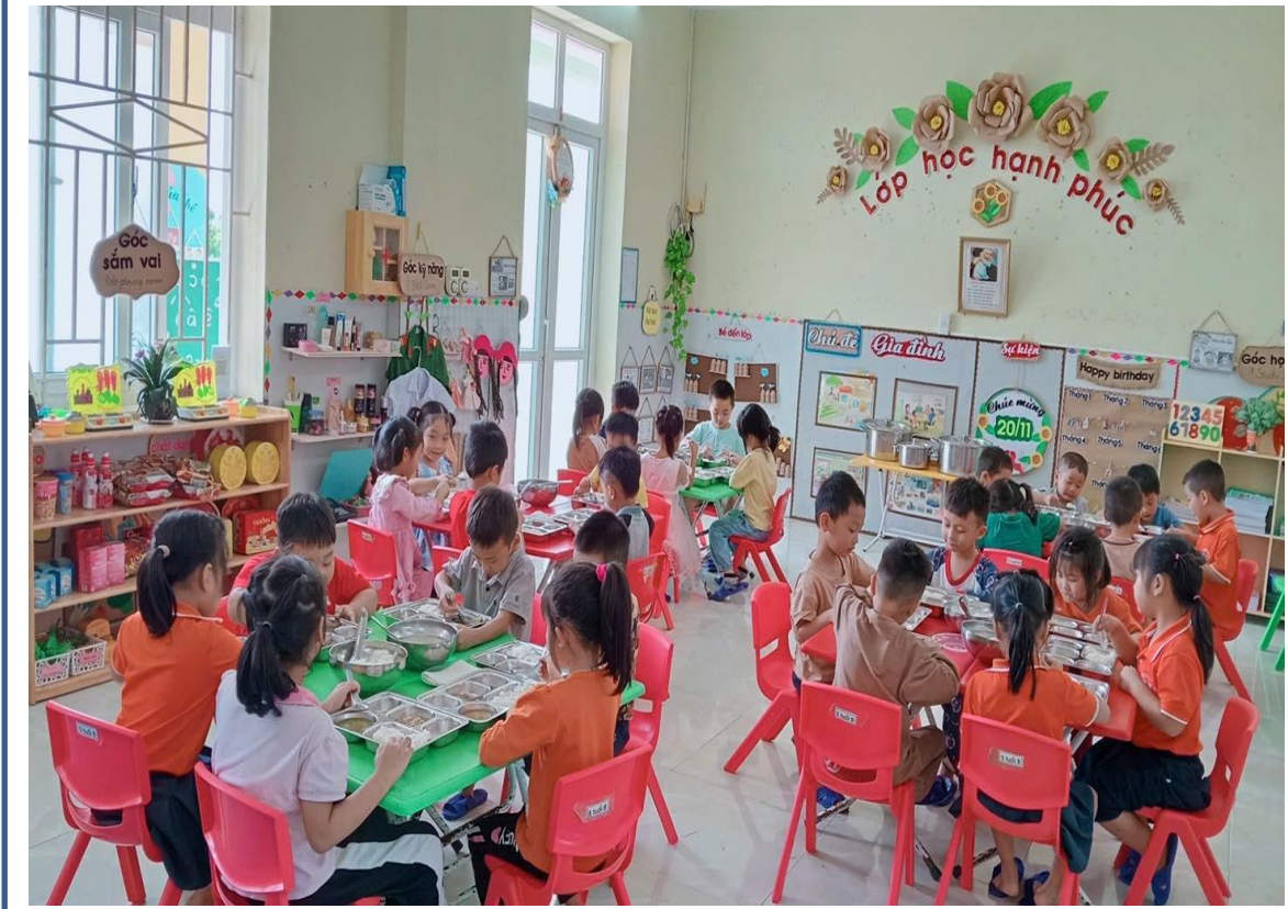
Hình ảnh 15: Giờ ăn trưa tại trường của trẻ