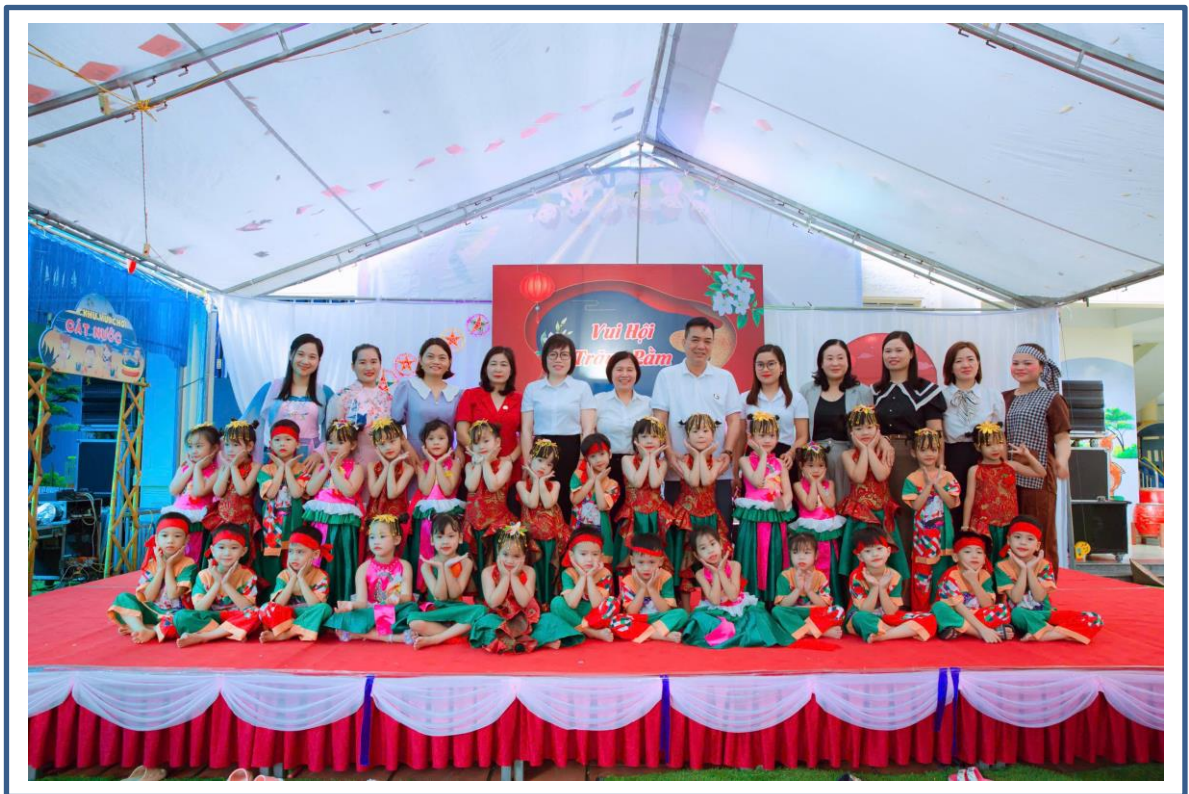
Hình ảnh 18: Phụ huynh tham gia ngày hội ở trường./