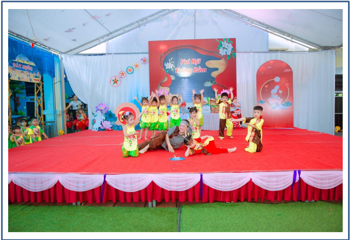
Hình ảnh 9: Trẻ múa theo nhóm