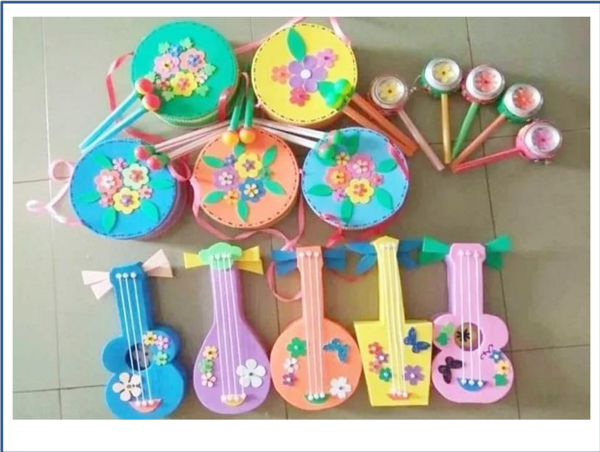
Hình ảnh 7: Dụng cụ âm nhạc được làm từ xốp, dạ nỉ, lon bia...