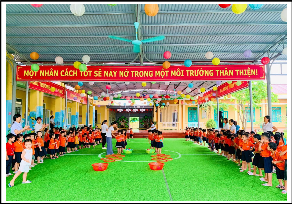
Hình ảnh 12: Trẻ chơi TC “đổi nhạc, đổi điệu”