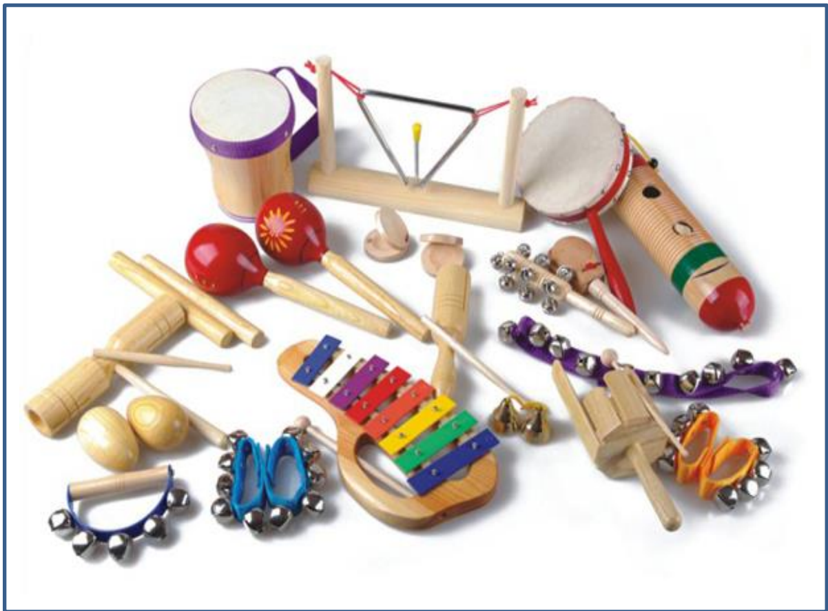
Hình ảnh 6: Dụng cụ bộ gõ được làm bằng tre, gỗ..