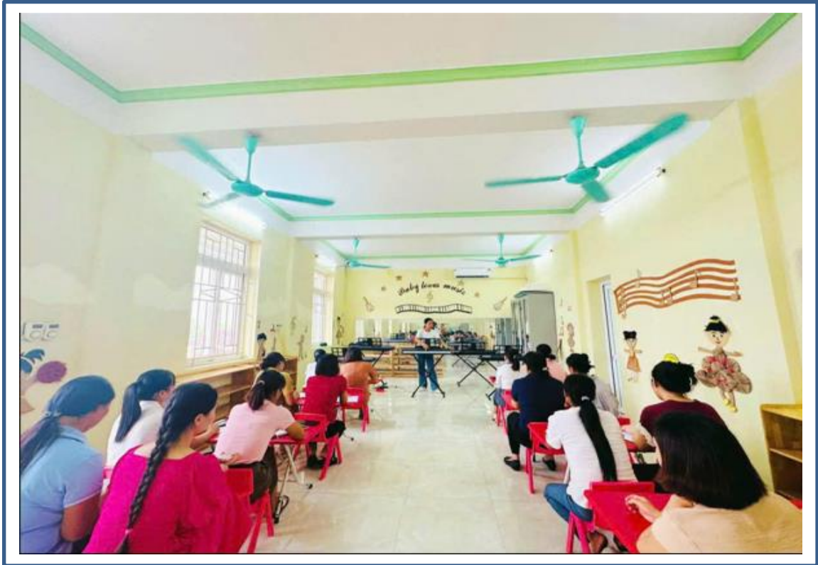
Hình ảnh 1: Giáo viên tham gia lớp tập huấn bồi dưỡng chuyên môn