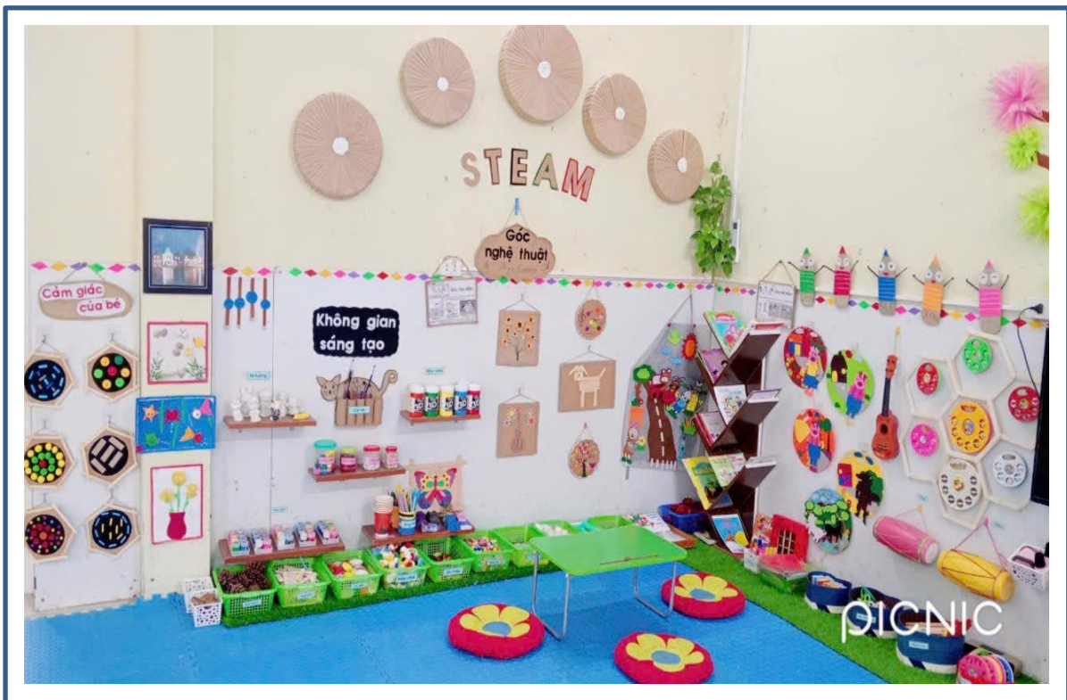
Hình ảnh 4: Góc nghệ thuật