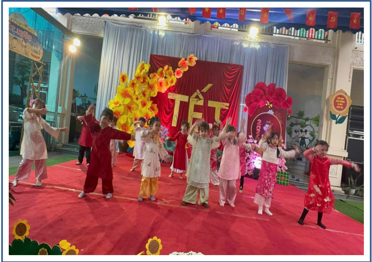
Hình ảnh 17: Trẻ biểu diễn văn nghệ chào xuân