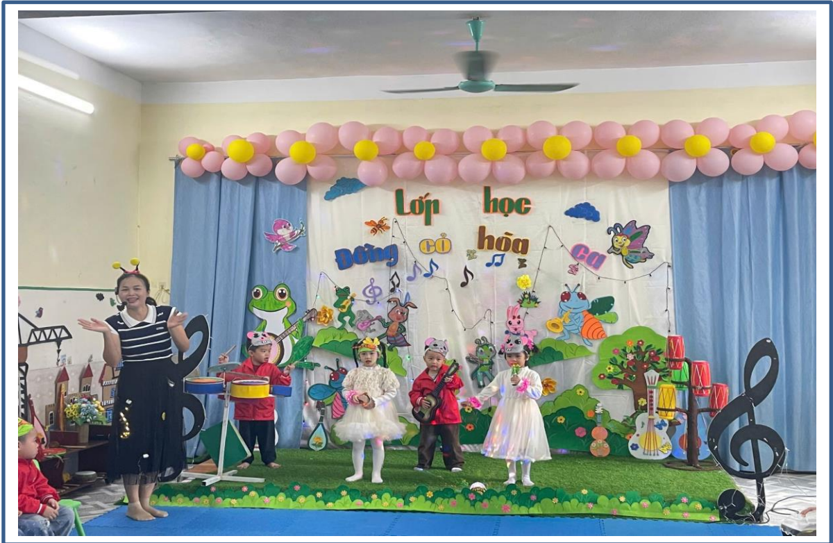
Hình ảnh 5: Giờ hoạt động âm nhạc