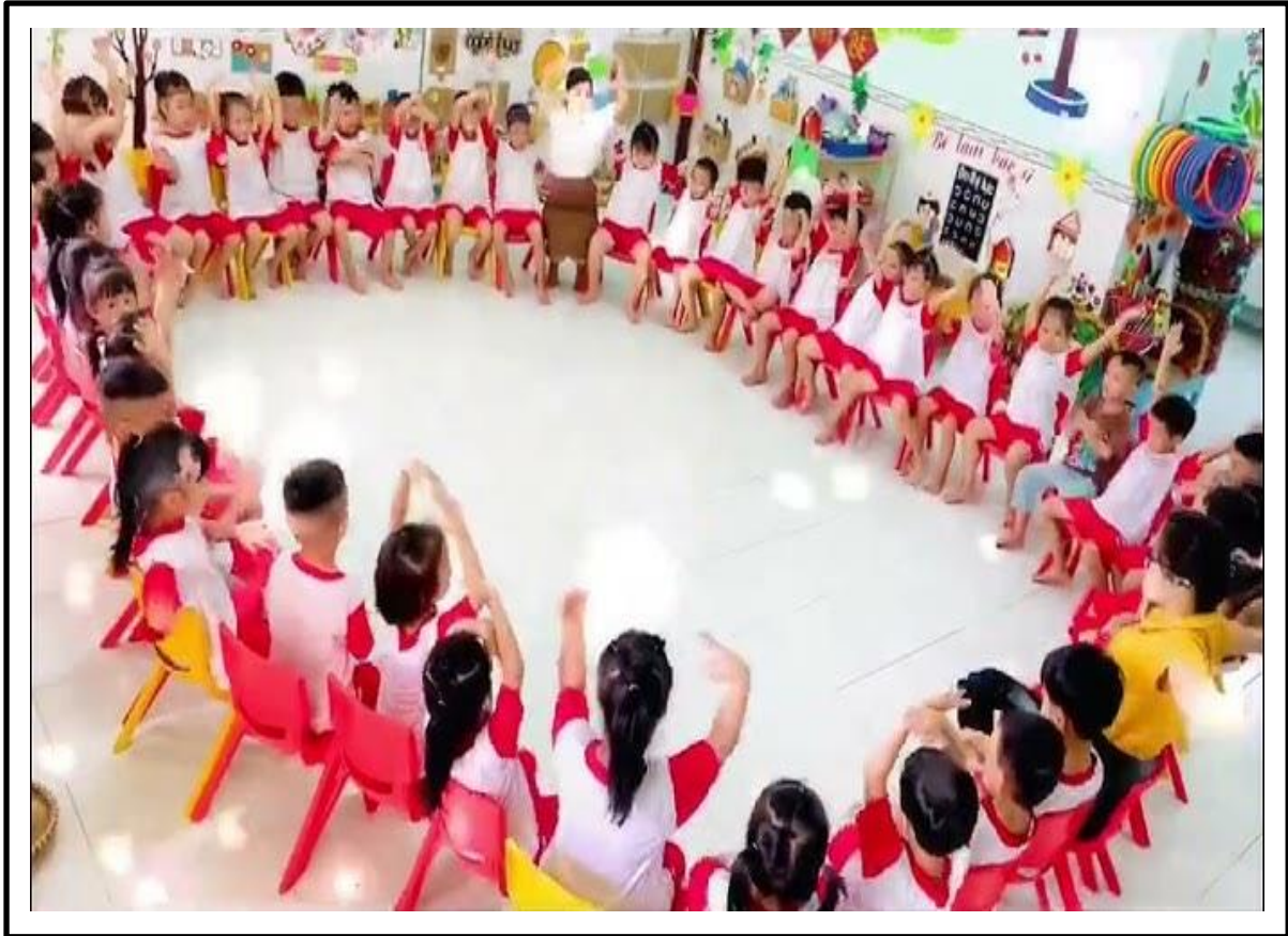
Hình ảnh 3: Trẻ tham gia chơi TC “Tiết tấu vui nhộn”