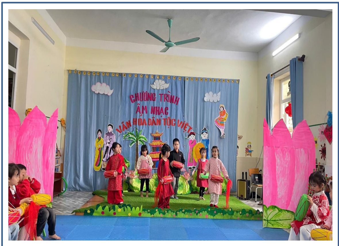
Hình ảnh 10: Trẻ biểu diễn văn nghệ