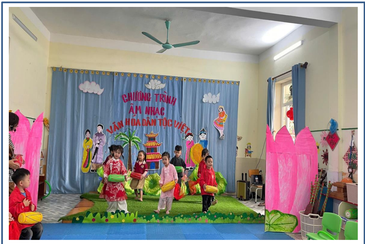
Hình ảnh 2: Hoạt động âm nhạc theo hướng tiếp cận đa văn hóa